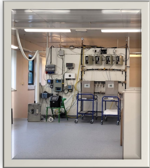
Figur 2: Utvecklingen av testbädden Källby vattenverkstad. T.v. ett tidigt stadie av verkstaden. T.h. ett senare, mer utvecklat och expanderat stadie av testverksamheten.